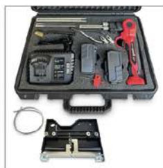
Kit de cuchillo térmico mostrado #HKT360CR6G-R