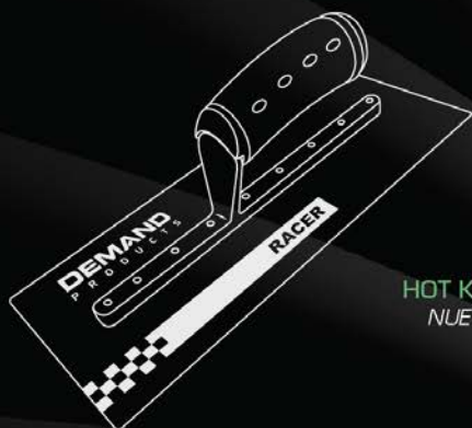
RACER TM ORIGINAL LLANAS PARA EIFS Y ESTUCO