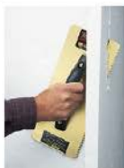
Funciona como disco de corte

Grano de tungsteno #12 soldado de alta resistencia