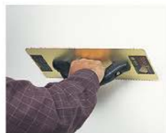
Rebaja puntos altos