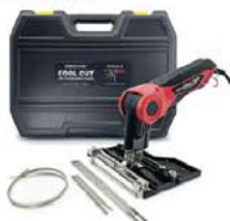
Kit de cuchillo térmico mostrado #KITCC6G-R