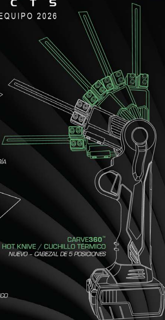
CARVE360 TM HOT KNIFE / CUCHILLO TÉRMICO NUEVO - CABEZAL DE 5 POSICIONES

EIFS | ESTUCO | ESPUMA | MAMPOSTERÍA | RECICLAJE | CNC