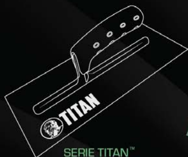
SERIE TITAN TM LLANA PARA MAMPOSTERÍA